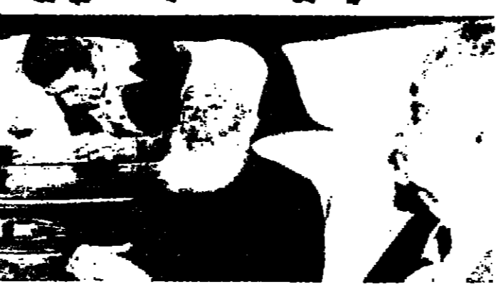
ساحة عمل العمل بعد انقراضه لدى بسرحه